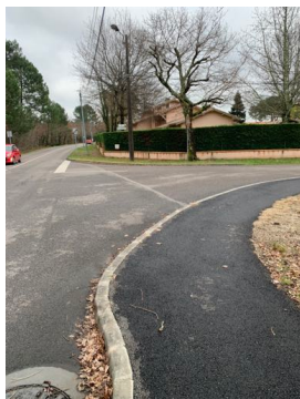
saut de trottoir pour aller tout droit, ou bien ne pas prendre du tout cette piste cyclable

Le cycliste n'a pas d'autres solutions que de mettre pied à terre, descendre de son vélo, traverser la route du stade en direction du panneau stop et choisir sa direction, en tournant à droite pour repartir par ex.