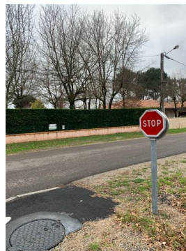
sortie de piste non sécurisée